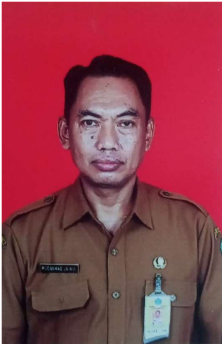
FOTO KEPALA DESA SIDOKEPUNG